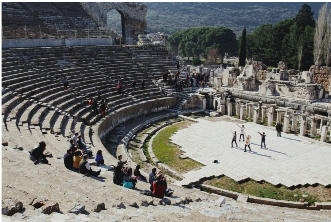
以弗所戲園，底米丟鼓噪鬧事處